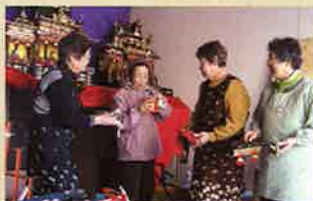
郡中がお雑様で彩られる「郡中ひなかさざり」は、いっぶく亭メンバーの主催のメイン行事。