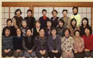
明るく迎えてくれるいっぶく亭のみなさん。