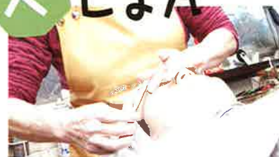
輝く肌おを手に入れてみませんか

シェービングは男性の特権!! ではありません。襟足や顔のうぶ毛を処理すると、お肌のくすみ・カサカサ解消、お化粧のり抜群に!! 遠赤外線の効果を活用しながら襟足、お顔のシェービング、マッサージ、保湿シートパック等ビューティーマジックで美肌に変身!!